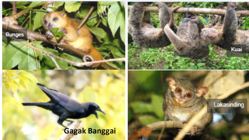
Gambar III.5 Satwa Endemik Banggai Kepulauan

dapat ditemukan di Kepulauan Banggai hingga Sula-Taliabu dan tidak ada di tempat lain, demikian juga dengan Kuai terdapat di Banggai Kepulauan. Lebih lanjut, terdapat pula salah satu mamalia terkecil di dunia yaitu Lakasinding ( Tarsius spectrum pelingensis ) dan beberapa ahli primata di dunia menduga bahwa jenis ini mungkin merupakan bentuk (takson) yang unik dan hanya terdapat di Banggai Kepulauan.