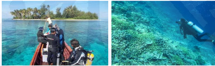
Gambar III.11 Pulau Tikus Sebagai Potensi Wisata Bahari Banggai Kepulauan

kualitas air dan lingkungan yang masih baik, serta ekosistem terumbu karang yang indah dan menarik.