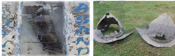
Gambar III.12 Pedang Masanda dan Topi Perang

Terdapat juga beberapa situs peninggalan sejarah di daerah ini, misalnya Benteng Bungkuko Pusako yang berada di puncak bukit, 4 km dari Desa Sambuit, Kecamatan Totikum. Bungkuko dalam bahasa Banggai berarti gunung. Bebatuan yang mengelilinginya konon didatangkan dari Pulau Jawa oleh para leluhur. Menurut cerita, benteng ini merupakan istana nenek moyang penduduk Sambuit yang seharusnya menjadi Raja Banggai yang pertama, yaitu seorang pemuda tukang timba air yang ternyata juga keturunan bangsawan bernama Bailungku. Bailungku adalah salah satu dari empat putra Tomundo (raja) Babolau yang pandai dan bijaksana. Selain benteng, ditemukan pula pedang Masanda. Menurut cerita rakyat yang beredar, Masanda adalah salah seorang pemimpin tentara Kerajaan Majapahit yang pernah bekerja sama dengan Kerajaan Banggai untuk membunuh Adi Bungkuko, putra dari Bailungku. Namun, niat tersebut diurungkan. Beberapa pasukannya akhirnya menikah dengan masyarakat di Pulau Peling. Masanda yang bijaksana konon dipercaya sebagai Mahapatih Gajah Mada. Pedang atau parang milik Masanda kini disimpan di Desa Unu, Kecamatan Bulagi. Selain itu, ditemukan juga topi perang Prajurit Tobelo sebagai bukti pernah terjadi perlawanan antara kerajaan Banggai dengan Kerajaan Tobelo.