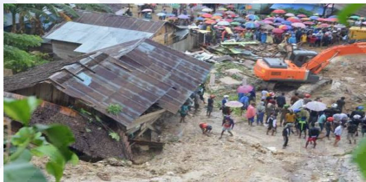
Gambar III.9 Longsor di Salakan

Kawasan yang rawan bencana gerakan tanah umumnya terdapat pada wilayah yang mempunyai jenis tanah lapuk tingkat lanjut, kemiringan lereng curam, dan struktur geologinya tidak stabil dengan curah hujan yang tinggi. Namun, gerakan tanah dapat terjadi pula akibat adanya getaran gempa bumi. Berdasarkan pengamatan lapangan, di Kabupaten Banggai Kepulauan jarang dijumpai gerakan tanah, hal ini disebabkan batuan penyusunnya yang didominasi oleh batugamping yang relatif stabil. Walaupun demikian, potensi rawan gerakan tanah dijumpai pada daerah hasil pemotongan bukit untuk badan jalan, atau pada lereng-lereng perbukitan atau pegunungan yang curam, khususnya yang tersusun oleh batuan induk malihan sekis-gneis yang telah lapuk tingkat lanjut.