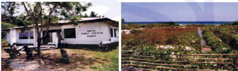
Gambar III.8 Kenampakan Kerusakan Bangunan di Kantor Kecamatan Totikum dan Penambahan Daratan 100 Meter ke Arah Laut di Desa Sambicut

Berdasarkan hasil kajian Geoteknologi LIPI (2004, dalam KLHS, 2012), geologi Kabupaten Banggai Kepulauan terletak di sepanjang zona tumbukan antara lempeng mikro kontinen Banggai - Sula dengan jalan ofiolit Sulawesi Timur. Tumbukan antara lempeng tersebut merupakan fenomena tektonik yang dicirikan dengan pergerakan sistem sesar sorong yang bergerak ke arah barat dan bersifat mendatar. Pergerakan Sesar Sorong yang masih aktif hingga sekarang ini, pada beberapa kali kejadian telah menimbulkan gempa bumi dengan magnitudo yang cukup besar. Seperti peristiwa gempa bumi pada 4 Mei 2000 dengan magnitudo 7,6 atau 6,5 skalarichter. Gempa bumi ini telah menimbulkan kerusakan yang cukup parah pada bangunan maupun infrastruktur lainnya di Kabupaten Banggai Kepulauan. Pusat gempa terletak di utara Pulau Peling dengan kedalaman 26 km di bawah permukaan air laut (gempa dangkal). Gempa tersebut juga menimbulkan gelombang tsunami di pantai utara Pulau Peling.