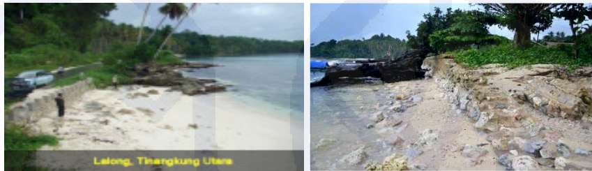
Gambar III.10 Kenampakan Abrasi Pantai di Banggai Kepulauan

Abrasi adalah proses erosi di sepanjang pantai yang disebabkan oleh fenomena arus dan gelombang, sedimen transport sepanjang pantai, morfologi pantai, dan keterbukaan pantai terhadap datangnya gelombang. Semakin kuat arus dan gelombang, serta semakin curam morfologi pantai, maka abrasi semakin tinggi. Proses abrasi pantai yang terjadi di Kabupaten Banggai Kepulauan lebih disebabkan oleh besarnya energi gelombang dan kedudukan pantai terhadap arah datangnya gelombang. Abrasi pantai tersebut mampu mengikis lahan-lahan di tepian pantai dan mengancam kedudukan jalan di sepanjang wilayah pesisir. Abrasi pantai banyak dijumpai di sepanjang pantai utara dan timur Pulau Peling,