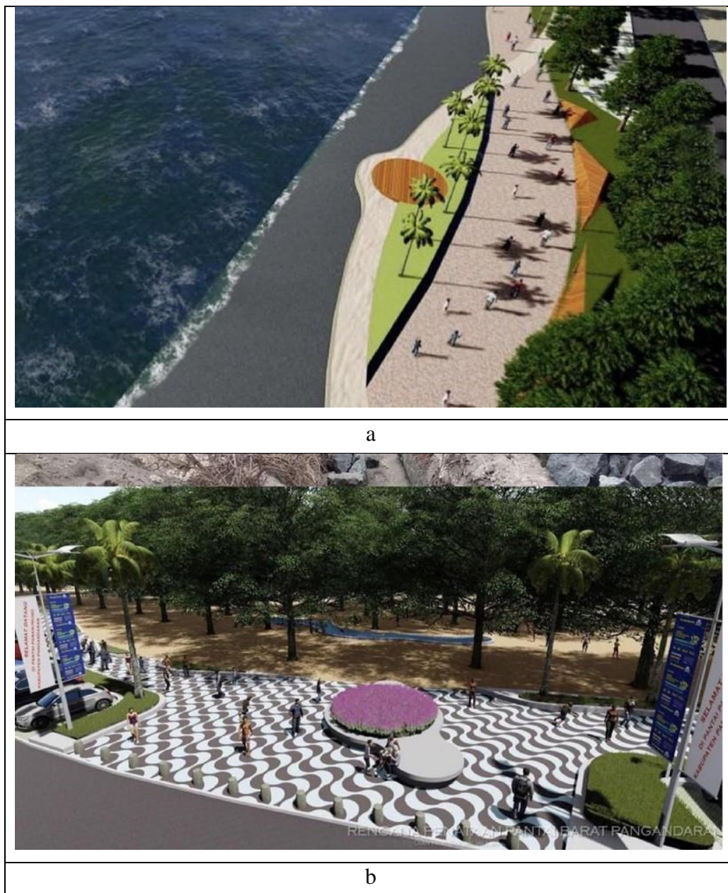
Gambar VII. 2 Desain tata kelola pembangunan wisata pesisir dan laut kabupaten Pangandaran: (a) pembangunan infrastruktur jalan pesisir pantai, (b) pembangunan ruang publik pesisir pantai

lokal yang berharga bagi generasi yang akan datang. Adapun tata kelola pembangunan wisata pesisir dan laut kabupaten Pangandaran dideskripsikan pada Gambar VII.2.