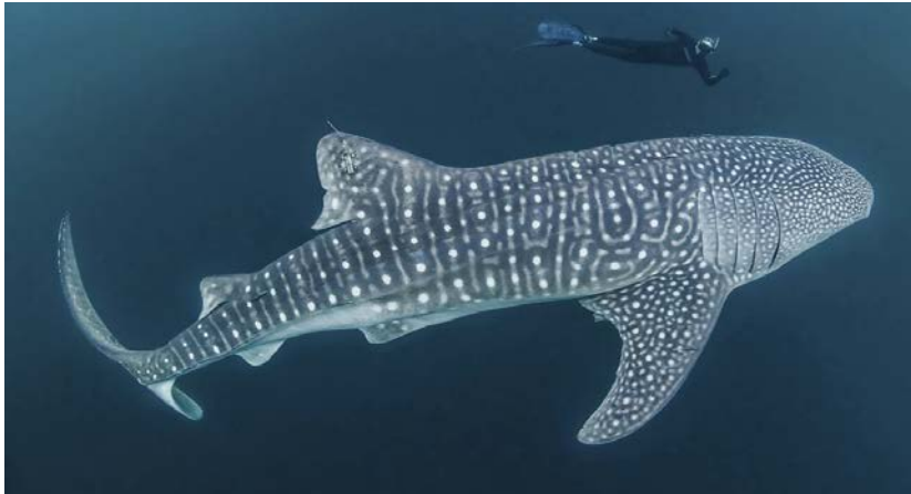
Gambar 2. 1 Ilustrasi Hiu Paus.

Pengetahuan terkait kontribusi hiu paus terhadap proses ekosistem lautan masih dalam tahap awal, yang dengan demikian belum banyak ditemukan hasil penelitiannya. Namun, diketahui bahwa spesies ini memiliki peran yang signifikan untuk mengangkut nutrisi dari perairan produktif dan wilayah lepas pantai ( offshore ) ke wilayah yang memiliki sedikit nutrisi, seperti sebagian besar habitat perairan tropis (Pierce, S.J. dkk, 2022).